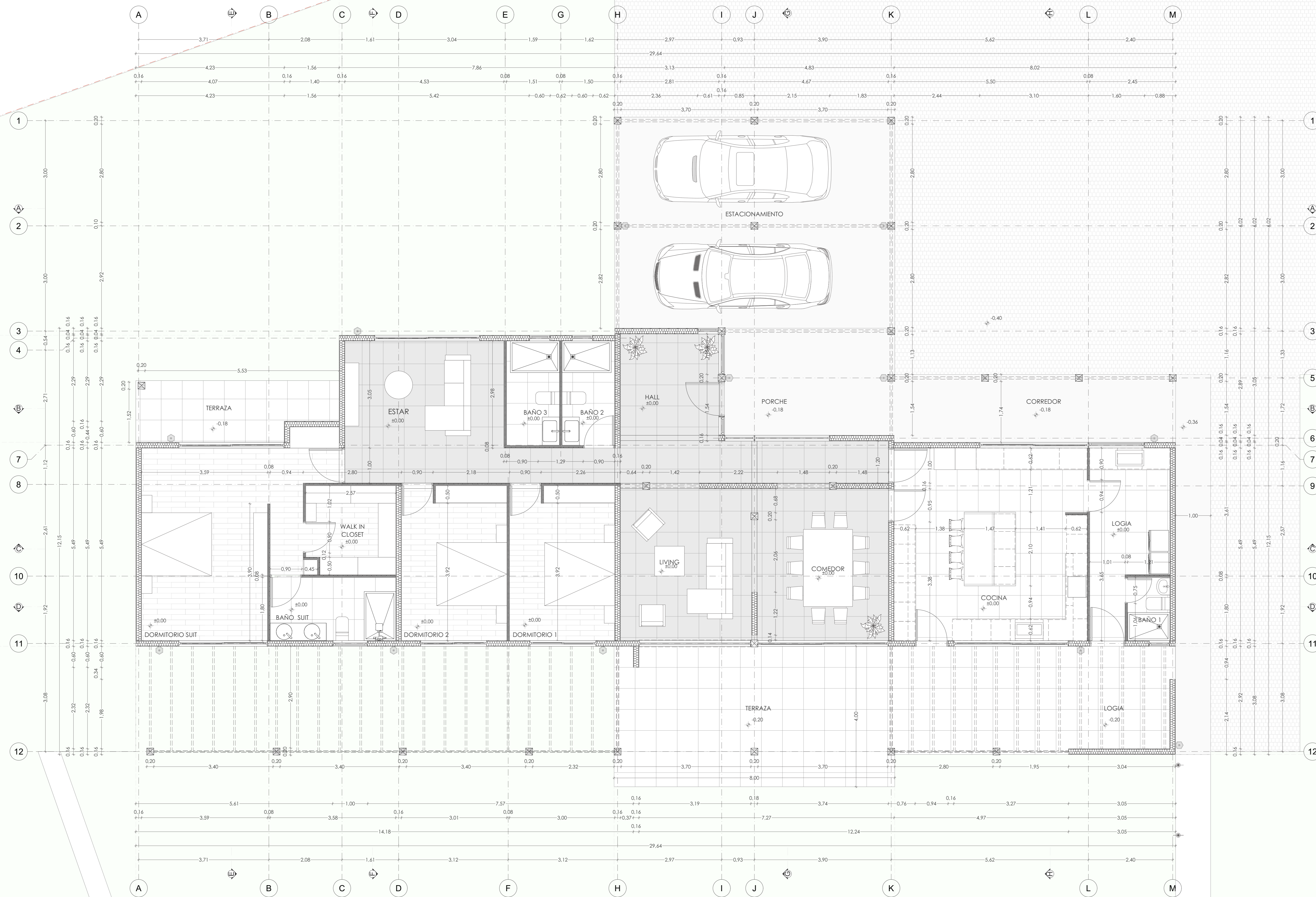
Planta Arquitectura Casa Escala 1:50